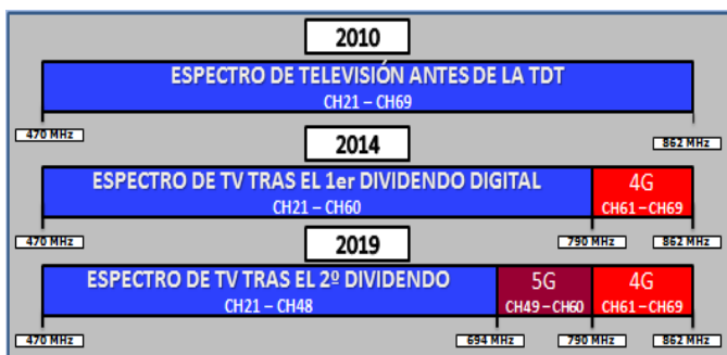
GRÁFICO HISTÓRICO DE FRECUENCIAS DE TDT

Para ello se debe liberar unas frecuencias para que las use el servicio del 5G, tal como pasó en 2014 con el 4G. Las frecuencias a liberar están comprendidos los canales de TDT del 49 al 60 . Esta adaptación se debe realizar entre Julio 2019 y Junio 2020 en toda España.